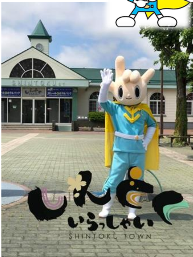
③着ぐるみの貸し出し