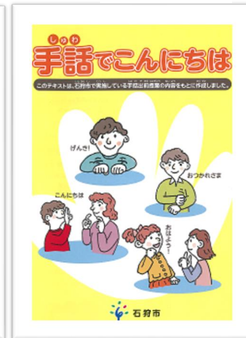
④市民向け手話リーフレット