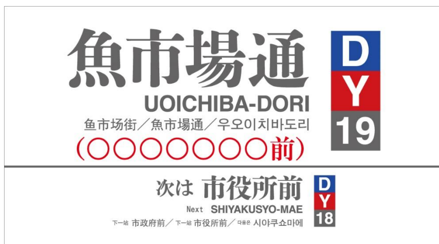
電停名表示器の表示例