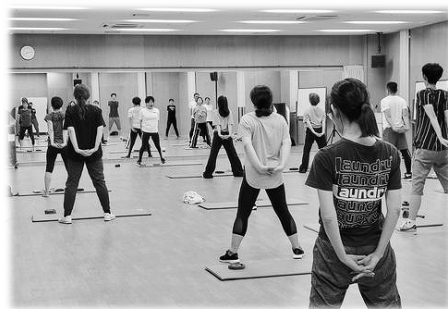
▲スタジオプログラムの様子▲