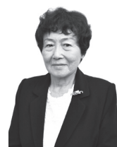
函館山の歴史研究と自然環境保護に尽力 (自然科学・人文科学)

スペイン・バスク地方のバル文化に着想を得ながら、本市の西部地区の街並み、食文化、音楽、芸術などの多様な文化が融合された「函館西部地区バル街」を20年以上にわたり開催しており、函館独自のスタイルとして広く発信してきました。長年、地域経済に好影響を与えてきたほか、本市のブランド力向上などにも繋がっており、本市文化の振興・発展に貢献しました。