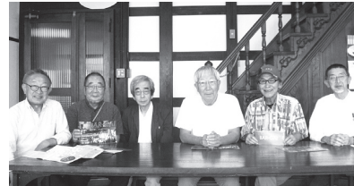
函館西部地区バル街の開催に尽力 (食文化)

昭和35年にアカシア会ピアノ教室を設立し、本年、創立65周年を迎えました。これまで数多くの音楽活動で活躍する人物を輩出するとともに、市内の学生の指導に携わるなど、後進の育成に努めました。また、長年、函館音楽協会の発展に尽力したほか、日本ショパン協会北海道支部函館地区委員長として演奏会の企画および開催を行い、本市の音楽文化の振興に貢献しました。