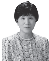
音楽の振興と後進育成に尽力 (音楽)

本市文化の振興・発展に貢献した方などに贈る「函館市文化賞」の受賞者が決定しました。贈呈式は10月31日にプレミアホテルCABIN PRESIDENT 函館で行います。