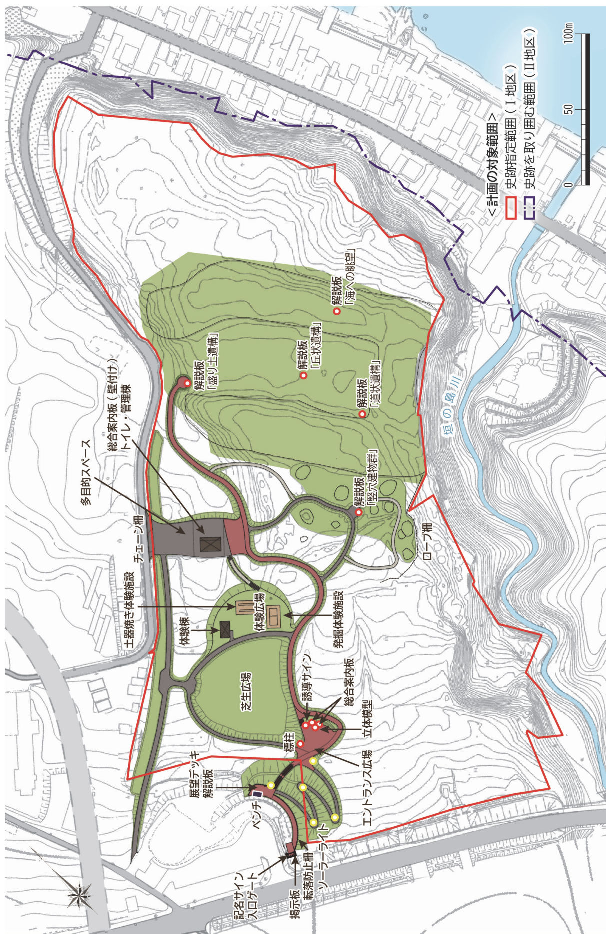
図9-1 整備平面図 (第一次整備事業 S=1/2,500)