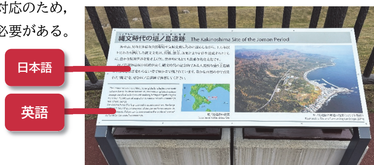
写真9-1 解説板(展望デッキ)