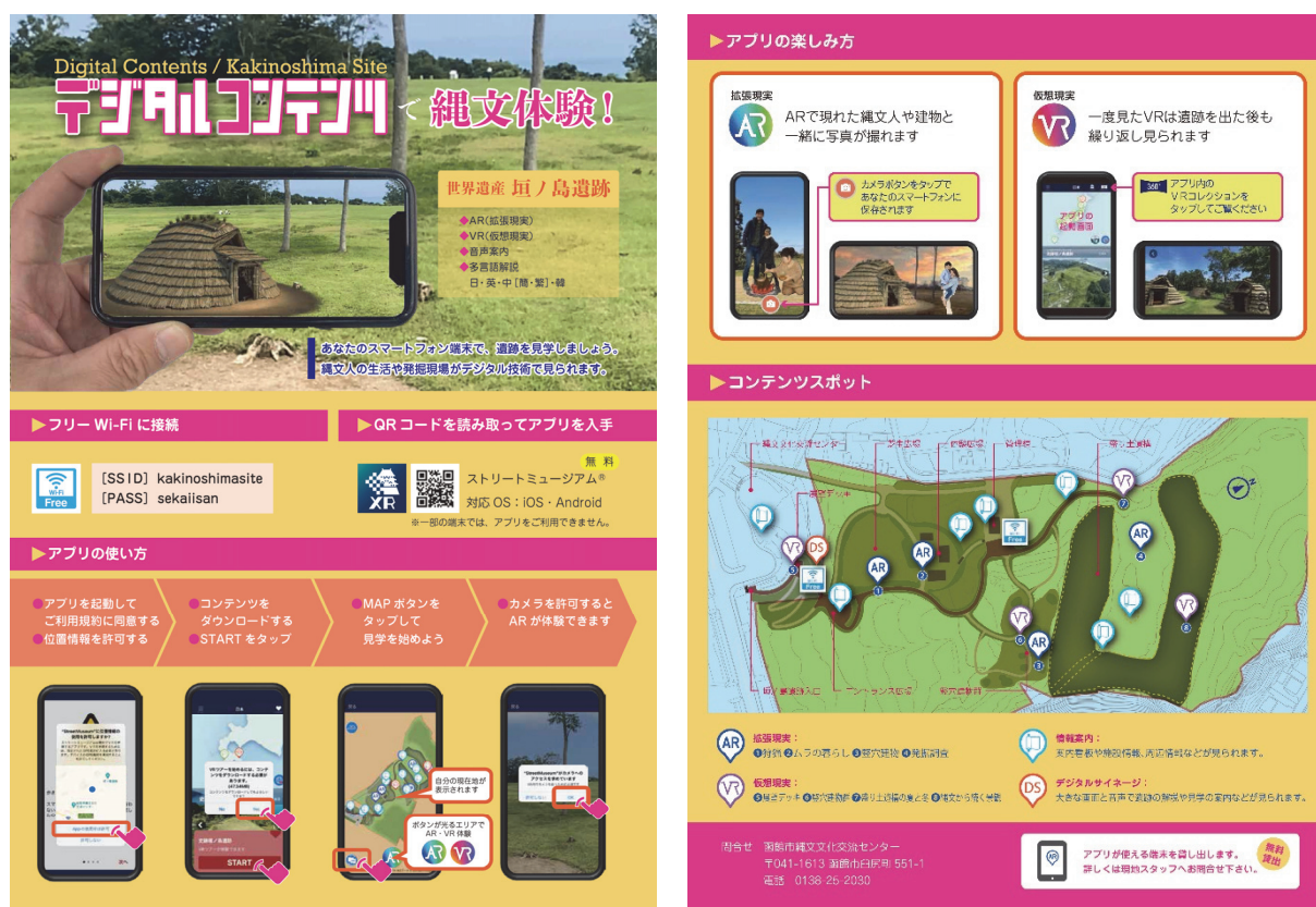
図9-2 デジタルコンテンツのチラシ