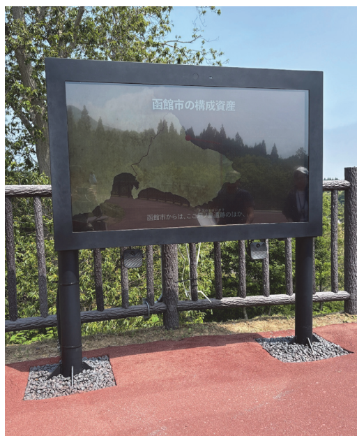
写真9-2 デジタルサイネージ