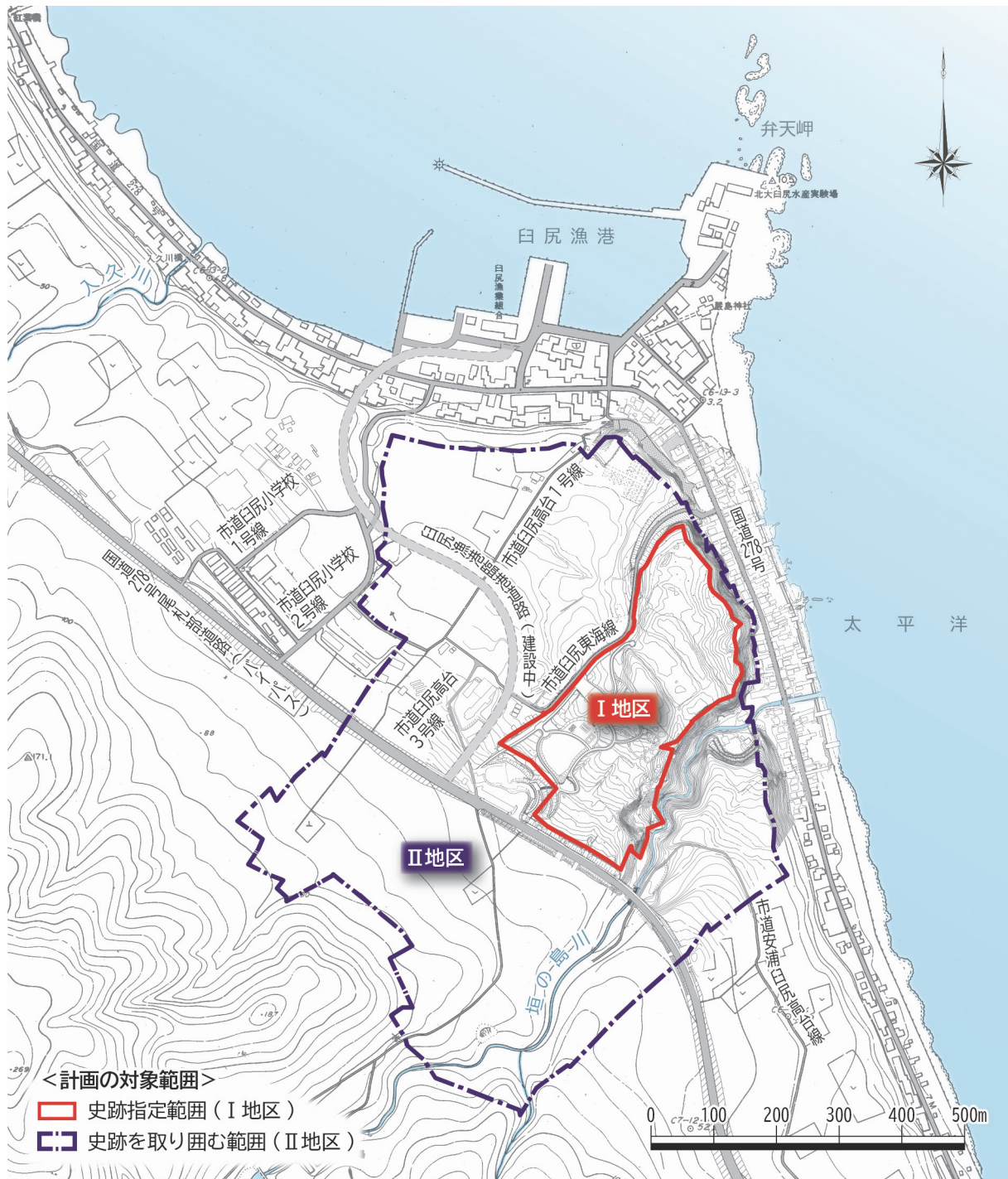
図1-2 計画の対象範囲図 (S=1/1万)

なお、この地区区分は「史跡垣ノ島遺跡保存管理計画」で定めた対象範囲を踏襲するものである。