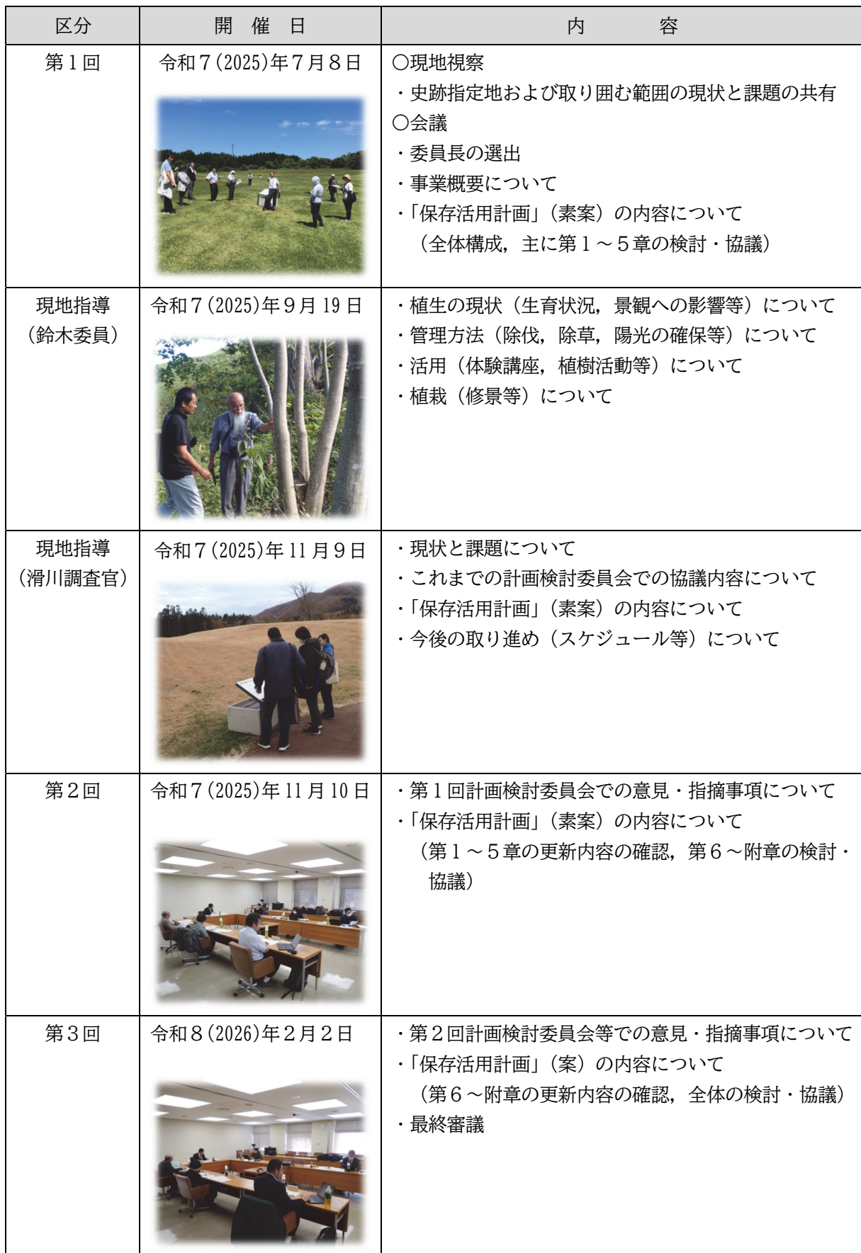
表1-3 計画検討委員会の協議内容