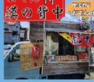
おでん侍 漢の背中