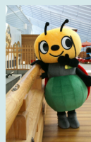
植物防疫所 「びーきゅん」

※天候等による航空機の遅れやイレギュラー時の対応等の理由により、一部変更または中止となる場合がございますので、ご了承のうえ、下記二次元コードよりお申込みください。