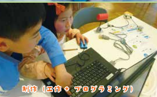
制作 (工作 + プログラミング)