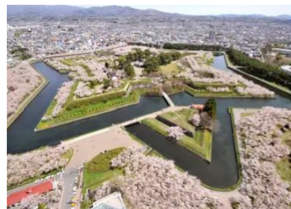
特別史跡「五稜郭跡」