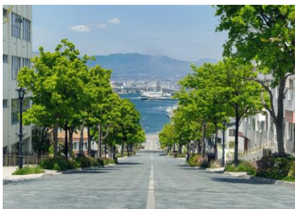
函館で人気のビュースポット「八幡坂」