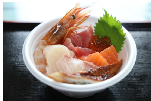
写真:海の幸 (イメージ)