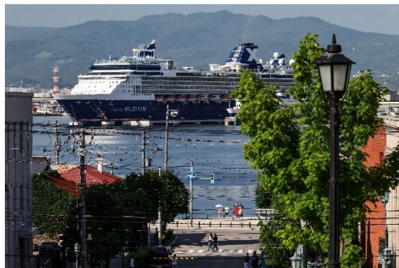
○入選「八幡坂より」 林 一哉