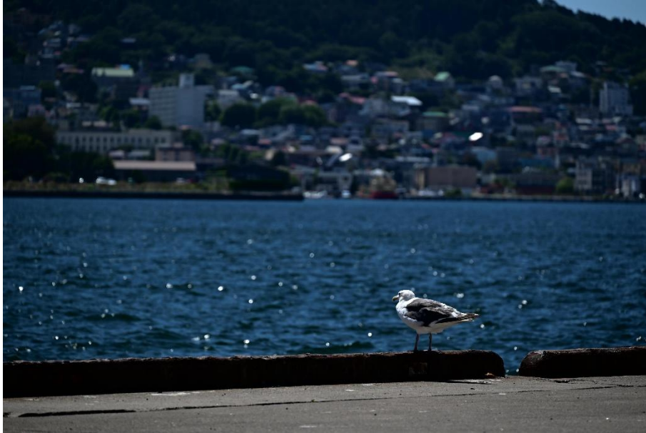
○優秀賞【プリント写真部門】 「今日も1日がんばるか〜」 熊谷 大翔