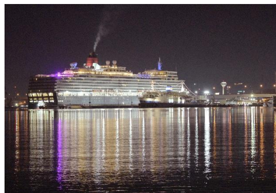
○入選「光の共演」 松森 美千代