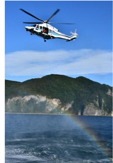
○佳作「海を見守る海保ヘリが虹を演出」 尾崎 渉