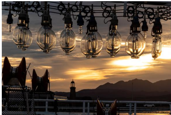
○佳作「夕暮れの輝き」 杉本 健一