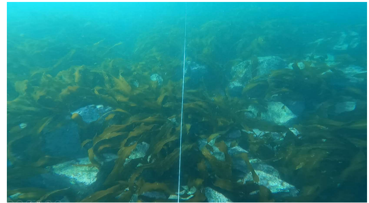
【函館近海天然藻場】