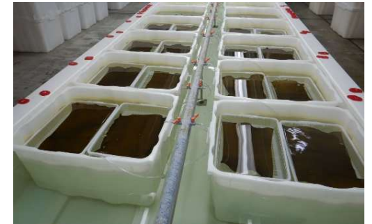
【成熟誘導試験の状況(R5.7月)】