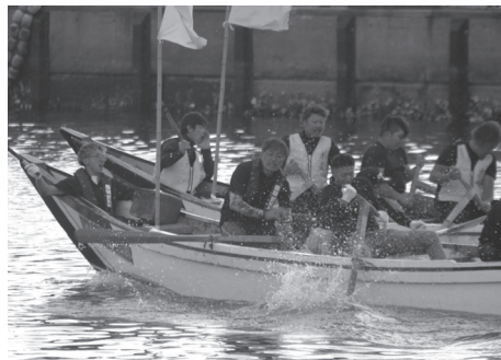
尾札部漁港で南かやべひろめ舟祭りが4年ぶりに開催されました。（6月）