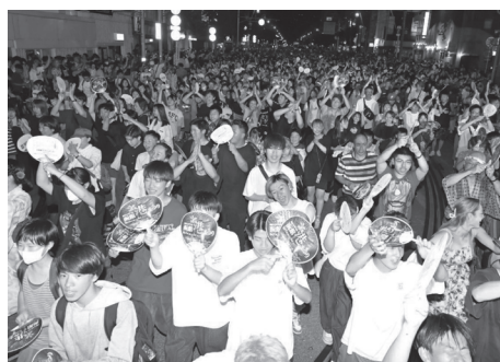
函館港まつりが開催され、4年ぶりに「いか踊り」が復活しました。（8月）