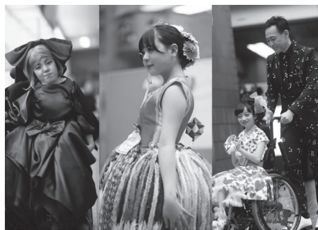
市役所本庁舎で函館コレクション2023が開催されました。（12月）