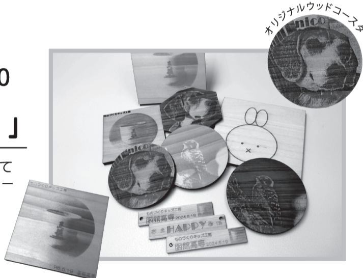
オリジナルウッドコースター