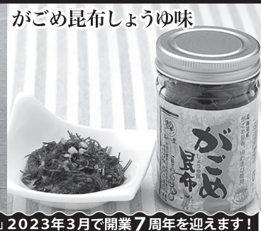
がごめ昆布しょうゆ味