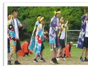
学校祭(体育部門)の様子

保護者や地域の方々は、学校への期待や関心が高く、学校行事や教育活動に対し、大変協力的です。