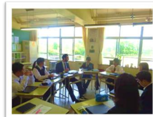
英会話の授業の様子