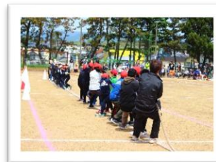
スポーツフェスティバルの様子