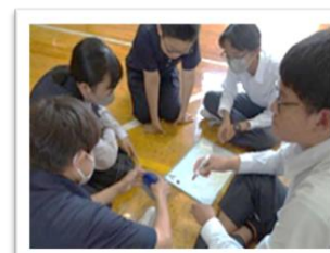
いじめ撲滅集会の様子