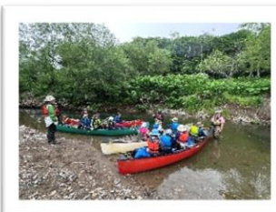
カヌー体験の様子

保護者や地域の方々は、学校への期待や関心が高く、学校行事や教育活動に対し、大変協力的です。