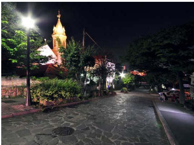
ガス灯をイメージした街灯に照らされた夜の大三坂