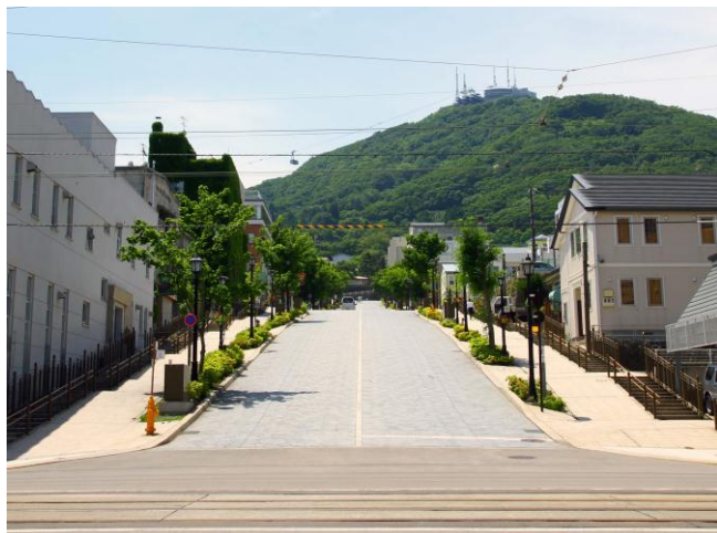
電車通りから見上げた風景