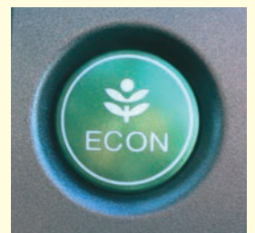
エコドライブスイッチの例

②エコドライブスイッチ ※ をONにしましょう。車の制御が変わって、ゆっくり加速しやすくなり、燃費が良くなります。