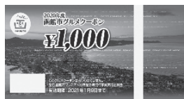
函館市グルメクーポン