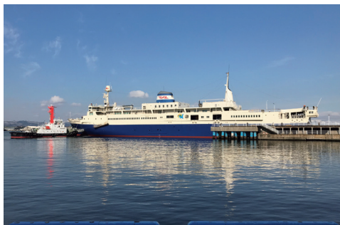
青函連絡船記念館摩周丸が船体塗装等改修工事のため17年ぶりに海上運航しました。