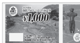
函館市プレミアム付商品券

有効期限を過ぎた商品券等の使用はできません。また、払い戻しもできませんので、期限内での使用をお願いします。