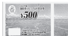
函館市プレミアム付飲食券