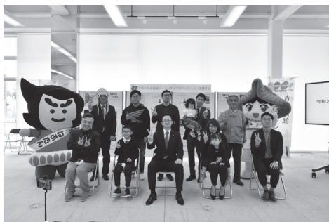
青函ツインシティ写真コンテスト表彰式

さて、両市は平成元年3月に「手をつなぐ、心をつなぐ ツインシティ」を合言葉に、ツインシティの盟約を交わしたことから交流がスタートし、