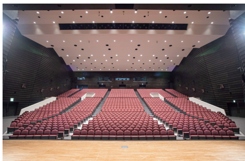
耐震等改修工事のため休館していた函館市民会館がリニューアルオープンしました。