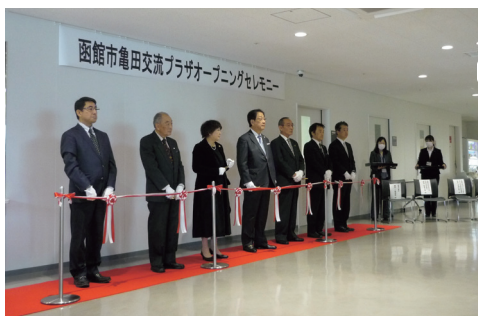
学習活動の場や多様な交流の場を提供する社会教育施設「亀田交流プラザ」がオープンしました。