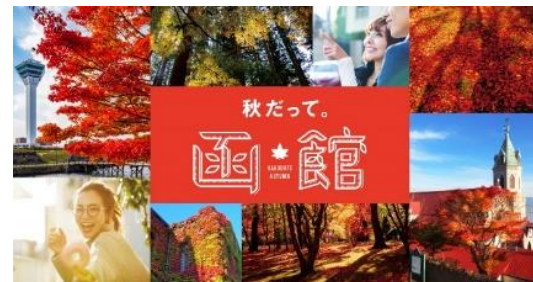
ランディングページ ビジュアル