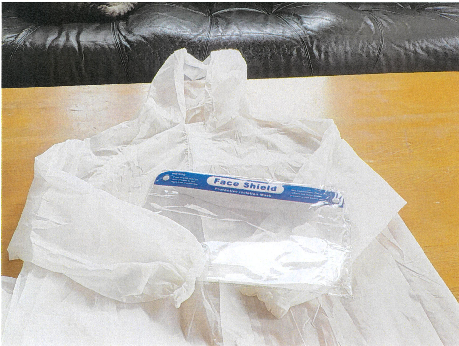
フェイスシールド&簡易防護服