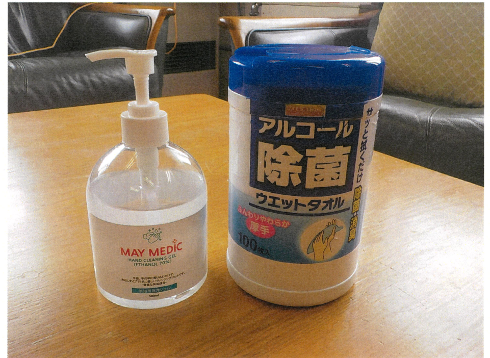
備品の確保(消毒液・マスク等)