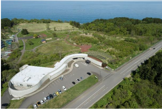
全景（縄文センター側）