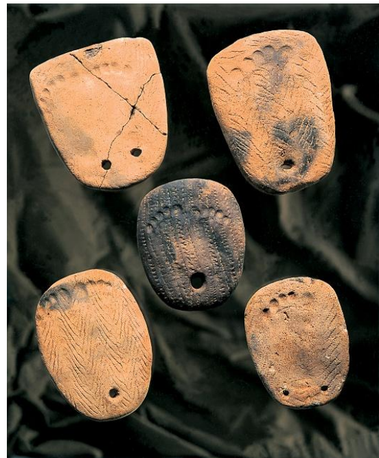
あしがたつきどぼん 足形付土版