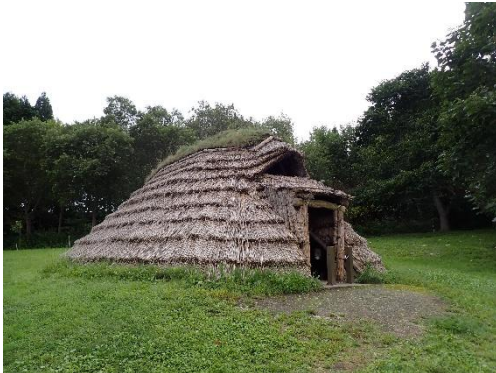
たてあな 竪穴建物 (完全復元)