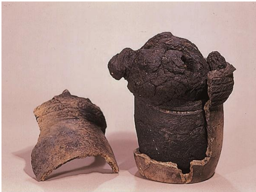
アスファルト入り土器