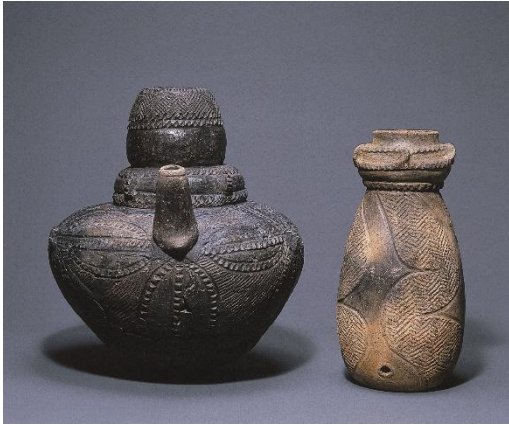
ちゅうこうどき かぶらゆうこうどき 注口土器・下部有孔土器