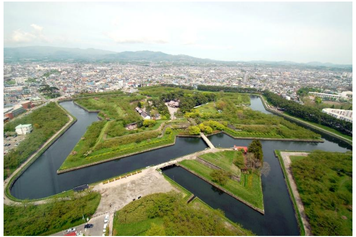
空撮②（五稜郭タワーから撮影）