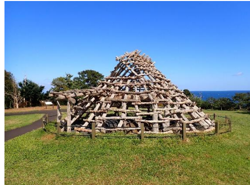
たてあな 竪穴建物 (立体表示)