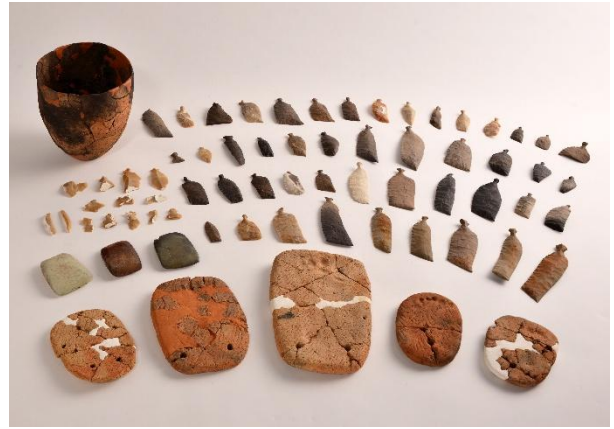
どこうしゅつどひん 土坑出土品