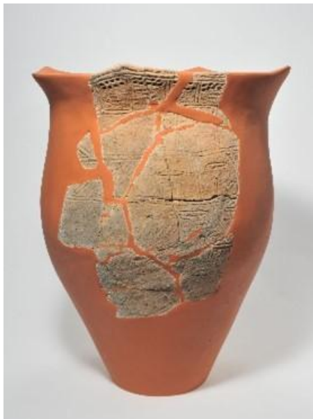
かいがどき シカ絵画土器