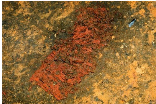
うるしせいひん 漆製品