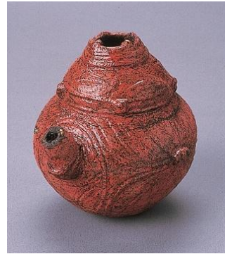
うるしぬ ちゅうこうどき 漆塗り注口土器