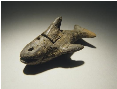
がたどせいひん シヤチ形土製品