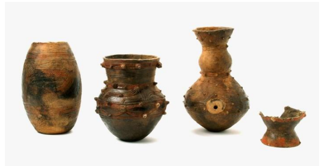
せきさいどき 赤彩土器