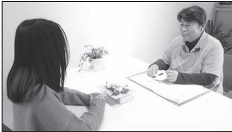
☎ 子育て支援コンシェルジュの様子

子育てに関する不安や悩みごとなど、子育てに関する様々な相談に、保育士資格を持つ専任の相談員が対応します。