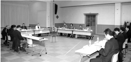
▲恵山地域審議会の様子

第2回地域審議会を、11月26日～29日に各支所で開催し、事務局から前回会議の意見等の集約結果と取組状況などについて説明があったほか、合併建設計画の執行状況や地域振興全般について意見交換が行われました。