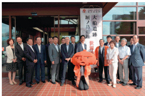
「北海道・北東北の縄文遺跡群」がユネスコ世界文化遺産の国内推薦候補に選定されました。