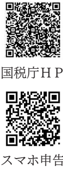
国税庁HP スマホ申告

詳しいことは函館税務署(☎31・3171)または国税庁のHPをご覧ください。 https://www.nta.go.jp/