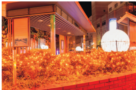
「湯の川冬の灯り」イルミネーション・ライトアップイベントがはじまりました。