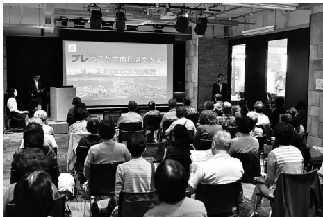
はこだて市民健康大学

これらの施策を通し、市民の皆様が安心して暮らせるまちづくりを進めてまいります。 本市における、平成30年度の観光入込客数は526万人を超え、北海道新幹線の開業以来、2年ぶりに増加したところです。