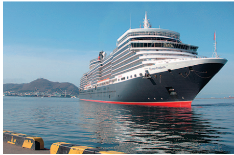
クルーズ客船「クイーン・エリザベス」が北海道に初寄港しました。