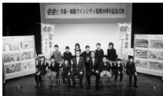
青森・函館ツインシティ提携30周年記念式典

この節目を記念とし、6月には函館市において青森工業高校ねぶた部指導の下、市立函館高等学校の美術部員の皆さんによる灯笼制作アート交流を皮切りに、8月には函館市と青森市から人気のグルメリートin浅虫を開催、9月には函館市で開催されたグルメサーカスへの参加、11月には青森・函館ツインシティ提携30周年記念式典を挙行、また、次代を担う子どもたちが描いた