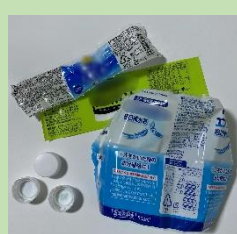
ペットボトルの キャップ・ラベル

汚れを落として「プラスチック容器包装」として出すことで、新たな資源として生まれ変わります。