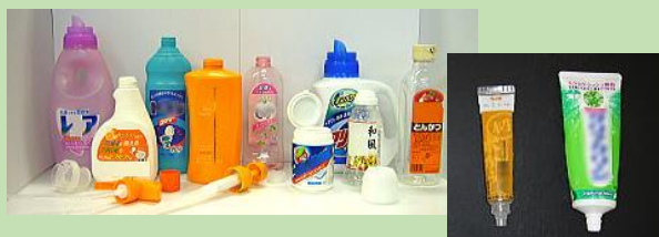
ボトルやチューブ