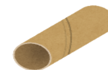
トイレトペーパー・ ラップ等の芯 など

町会などが行う「集団資源回収」に出すことで、トイレトペーパーやコピー用紙、段ボールなど、再び紙に生まれ変わります。