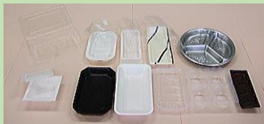
お弁当の容器や食品トレイ