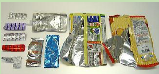
アルミとの複合素材