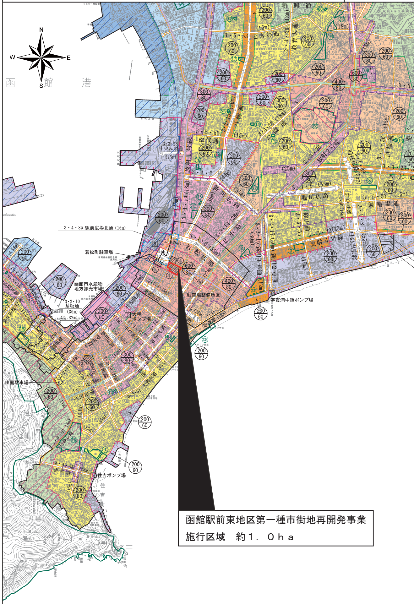
函館駅前東地区第一種市街地再開発事業 施行区域 約1.0ha