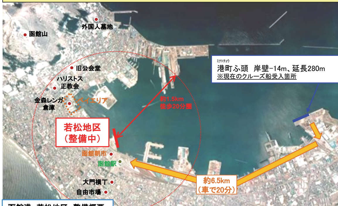
函館港 若松地区 整備概要