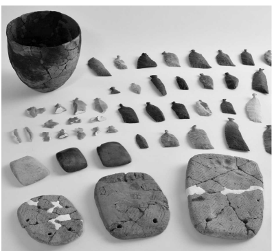
北海道豊原4遺跡土坑出土品