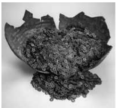
北海道志海苔中世遺構出土銭