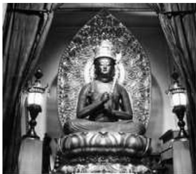
木造大日如来坐像