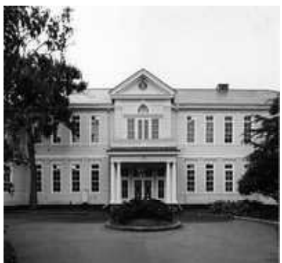
遺愛学院(旧遺愛女学校)本館