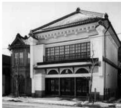
太刀川家住宅店舗