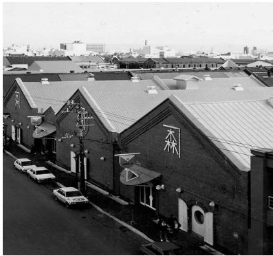
函館市元町末広町伝統的建造物群保存地区