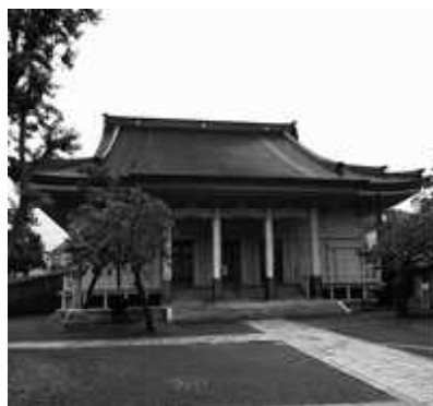
大谷派本願寺函館別院（本堂）