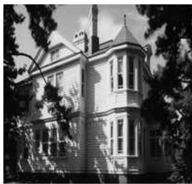
遺愛学院(旧遺愛女学校)旧宣教師館