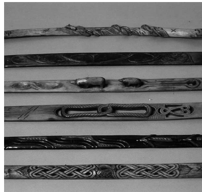
アイヌの生活用具コレクション