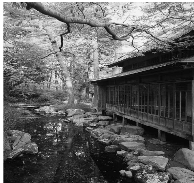
旧岩船氏庭園(香雪園)