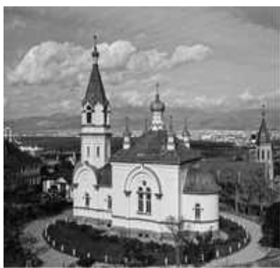
函館ハリストス正教会復活聖堂