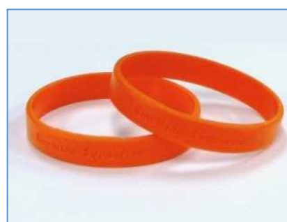
サポーターの証 オレンジリング