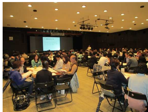
地域ケア全体会議の様子

地域住民および民生委員・児童委員などの地域の支援者，介護支援専門員等の多職種が集まり，個別ケースの支援内容の検討や地域の課題について話し合う会議。高齢者個人に対する支援の充実とともに，それを支える社会基盤の整備を同時に進めること。地域包括ケアシステムを構築していくための手法のひとつ。