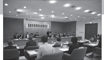
△南茅部地域審議会の様子

次回の地域審議会は、7月を予定しています。会議録は市のHPからご覧いただけます。