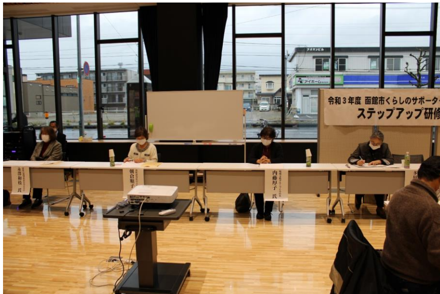
左：第3回目「サロン実践者発表」