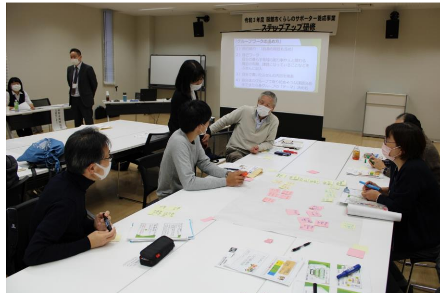
右：第4回目「地域ケア会議（模擬）を体験」