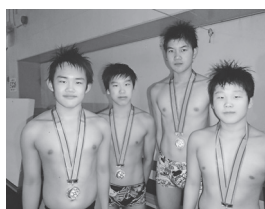
イトマン函館 男子200mメドレーリレーチーム

第37回全国JOCジュニアオリンピックカップ春季水泳競技大会 男子200mメドレーリレー 第2位