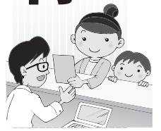
表1のとおり受付します。