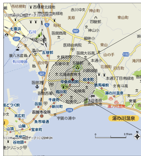
—凡例— ○: 半径2 kmの範囲を示す