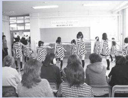
「シーズナルストレッチサークル」は、大勢のキッズたちによるエア・ダンスを披露しました。