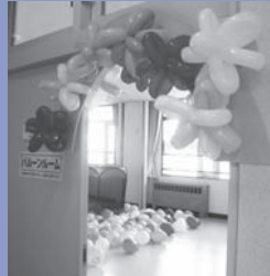
子どもたちに人気のパルーンルーム

「おいしい」、「楽しい」満載！の女性センターまつりに、みなさん、ぜひ足をお運びください。