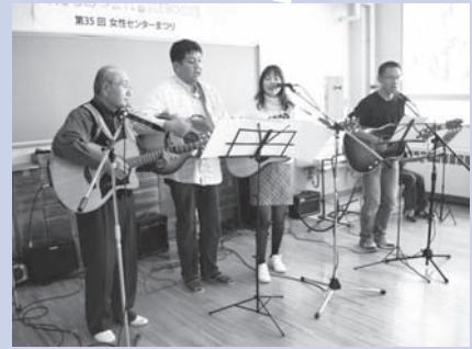
「如月ギターサークル」は、歌とギター演奏を披露しました。