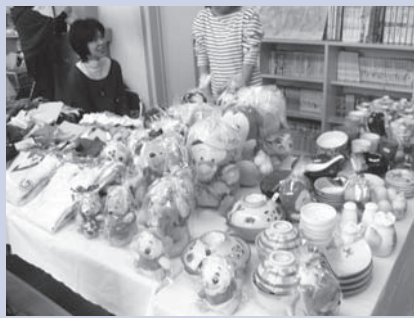
掘り出し物がいっぱいのパザール会場は、開店前から行列ができるほど人気があります。