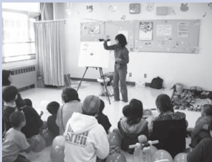
託児室では「人形劇の会」が、パネルシアターで、子ども向けに楽しいお話を演じました。