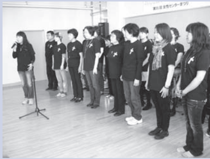
「ジョイフル フェローシップ クワイア」はゴスペルを披露しました。