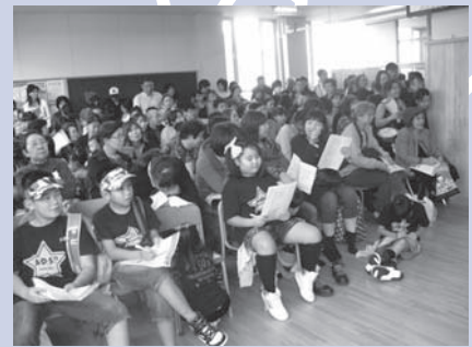
閉会式での抽選会には、たくさんの来場者が参加して、大いに盛り上がりました。