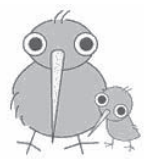
プロジェクトキャラクター「イクキューイクン」