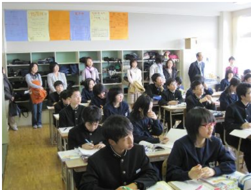
地域公開実践での授業風景