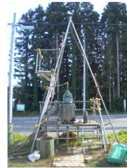
図-2 ボーリング調査