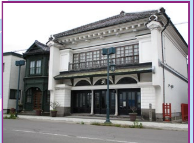
24 太刀川家住宅店舗