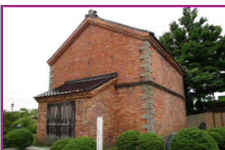
32 旧開拓使函館支庁書籍庫