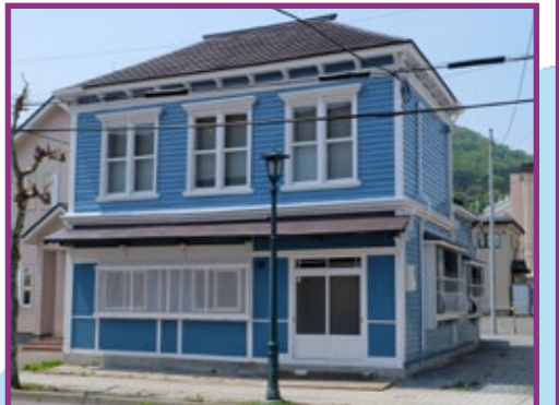
11 旧大津漁業函館営業所