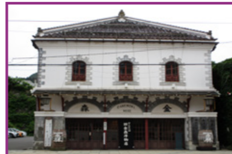
40 市立函館博物館郷土資料館