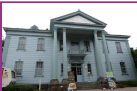
33 旧北海道庁函館支庁庁舎 (Jolly Jellyfish)