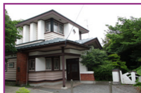
50 プレイリーハウス