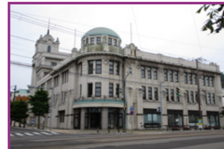
37 函館市地域交流まちづくりセンター