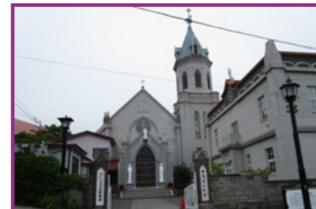
40-1・2・3・4 カトリック元町教会