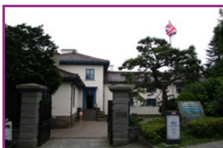
57 開港記念館(旧イギリス領事館)