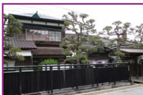
62-1・2・3・4 旧相馬家住宅