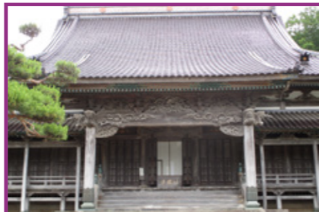
7 高龍寺 本堂