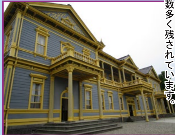
31-1・2 旧函館区公会堂