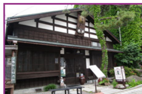
35 茶房 菊泉