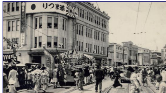
第 1 回港まつり