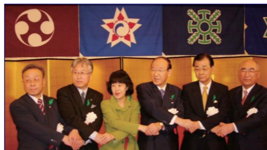
3 町 1 村との合併協定調印式