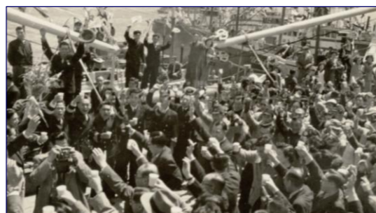
北洋漁業の出漁見送り風景