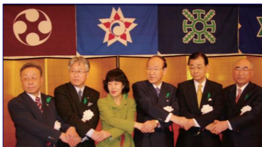
3 町 1 村との合併協定調印式