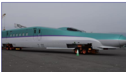
新幹線の車両の陸揚げ