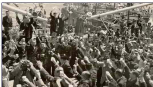
北洋漁業の出漁見送り風景