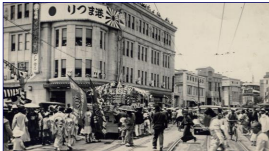
第 1 回港まつり