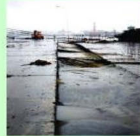
他港での緊急物資荷役状況