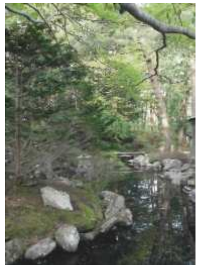
旧岩船氏庭園(香雪園)