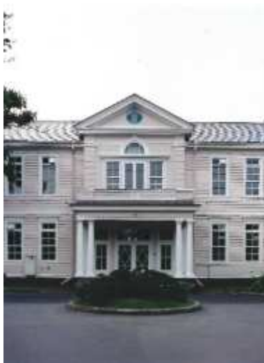
遺愛学院(旧遺愛女学校)本館