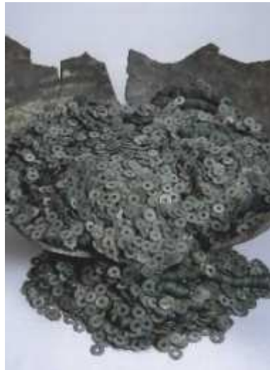
北海道志海苔中世遺構出土銭