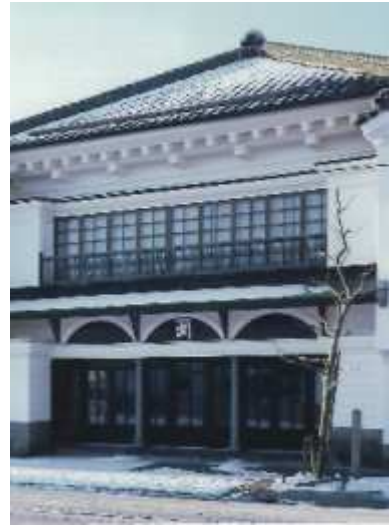
太刀川家住宅店舗