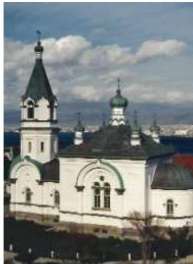
函館ハリストス正教会復活聖堂