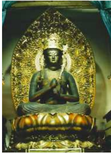
木造大日如来坐像