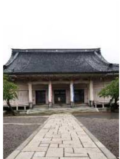
大谷派本願寺函館別院(本堂)