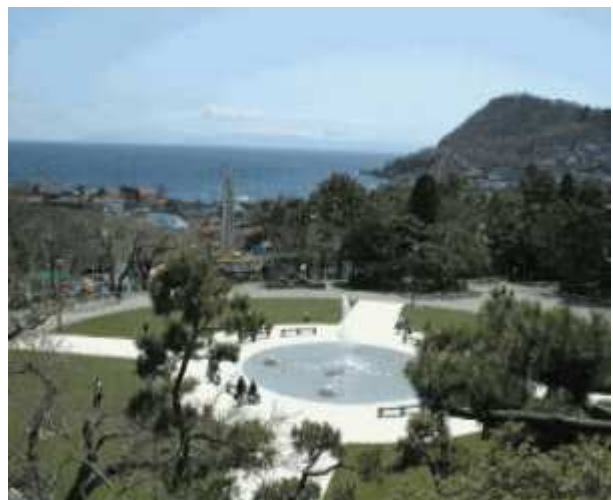
函館公園(登録記念物 名勝地)