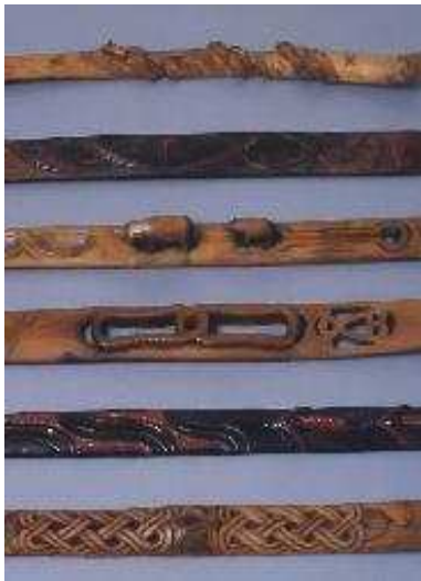
アイヌの生活用具コレクション