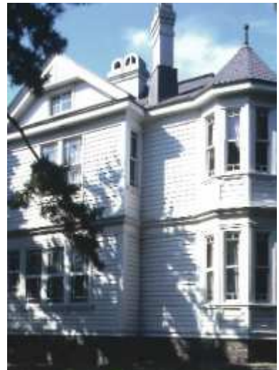
遺愛学院(旧遺愛女学校)旧宣教師館