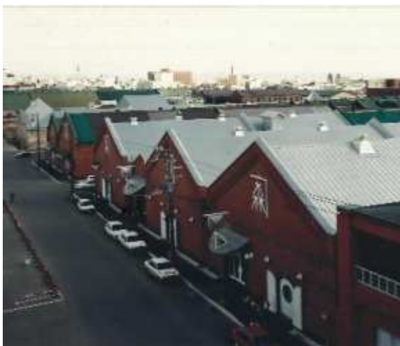
函館市元町末広町伝統的建造物群保存地区