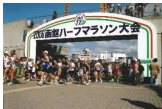
函館ハーフマラソン大会