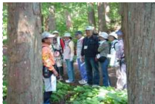
まなびっと2008体験講座 6月