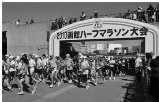
函館ハーフマラソン大会