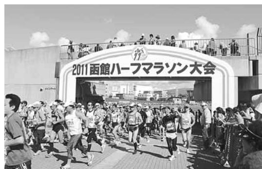
函館ハーフマラソン大会