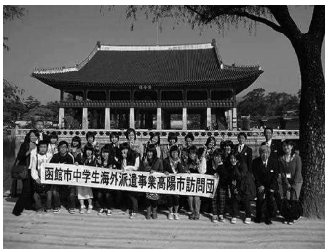
平成24年度 高陽市訪問団 (景福宮～慶會樓)