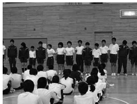
合同宿泊学習「オリエンテーション」