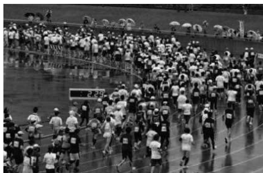
函館ハーフマラソン大会